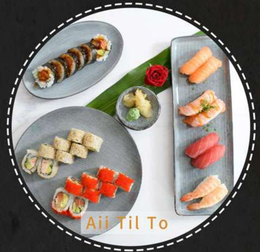
Aii Til To

Nigiri: 2stk yaki laks, 2stk tun, 2stk laks, 2stk rejer Uramaki: 8stk california, 8stk chili laks Futomaki: 6stk crispy ebi big