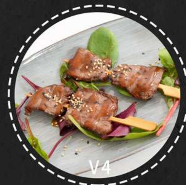
V4. Oksekød i Teriyaki --- 2stk(62kr)

Tigerrejer med salt, peber og teriyaki sauce