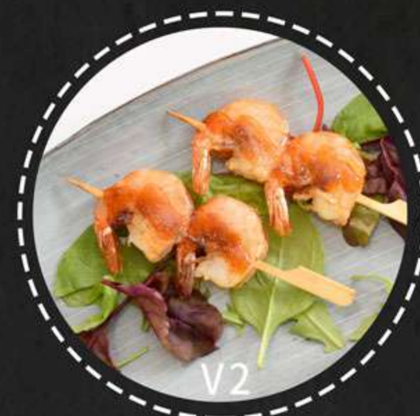
V2. Tigerrejer --- 2stk(55kr)

Wokstegte nudler med oksekød og grøntsager