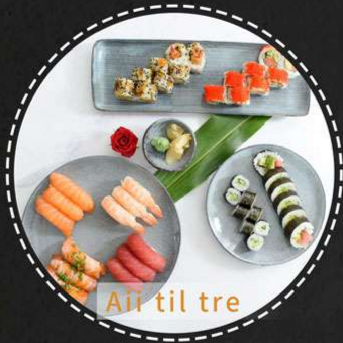
Aii til tre

Nigiri: 3stk laks, 3stk tun, 3stk yaki laks, 3stk rejer Uramaki: 8stk crispy ebi, 8stk chili laks Futomaki: 6stk tun big Hosomaki: 8stk agurk