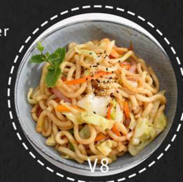
V8. Yakisoba Vegetar --- 85kr