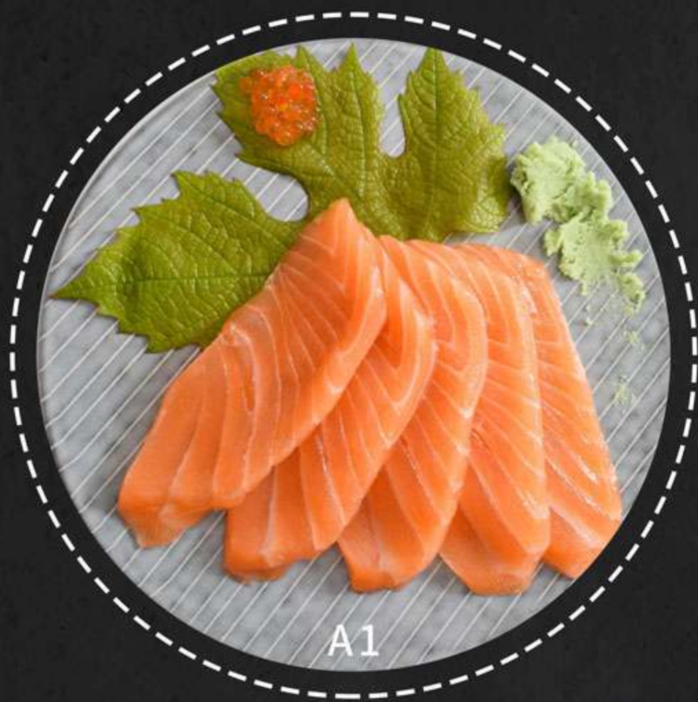
A1.Sashimi Laks --- 60kr