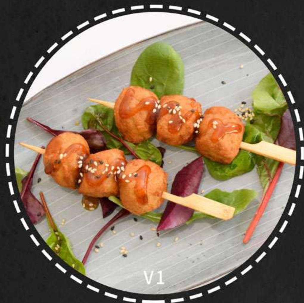
V1. Kyllingekødboller --- 2stk(50kr)