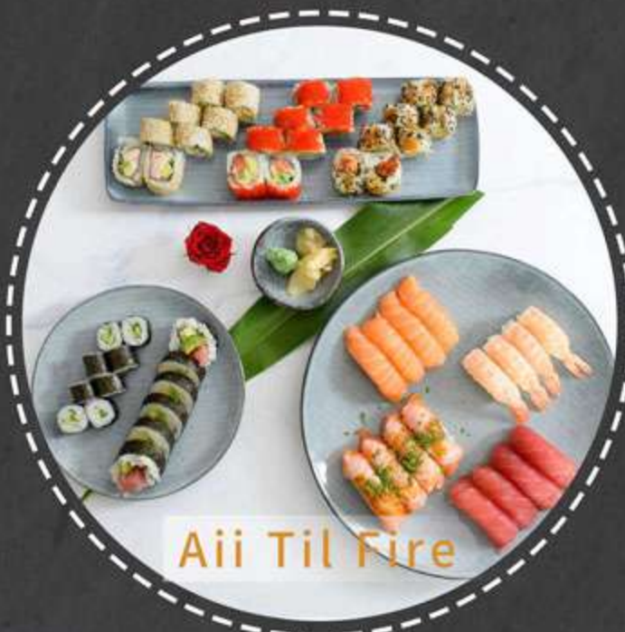
Aii Til Fire

Uramaki: 8stk crispy ebi Futomaki: 6stk tempura tun big, 6stk tempura laks big, 6stk tempura hvidfisk big